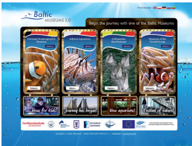
Gemeinsames Online-Portal der Meeresmuseen

Im Projekt BalticMuseums 2.0 entwickeln vier Meeresmuseen und zwei wissenschaftliche Partner innovative technische Informations- und Kommunikationslösungen für Touristen und Museumsbesucher. Projektpartner aus Deutschland, Polen, Russland und Litauen beteiligen sich. Das Projektteam beschäftigt sich mit der Entwicklung eines gemeinsamen Online-Auftritts sowie eines elektronischen Ticket-Systems. Ein weiterer Bestandteil ist die Entwicklung eines Konzeptes für ein zukunftsweisendes Besucherleit- und Informationssystem. Dieses könnte zum Beispiel Smartphones oder PDAs einbinden.